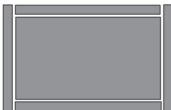
von oben Schema Schubladen